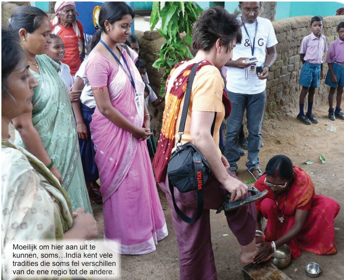
Moeilijk om hier aan uit te kunnen, soms... India kent vele tradities die soms fel verschillen van de ene regio tot de andere.

Het zou een vergissing zijn te besluiten dat dit land geen regels kent. Er wordt geclaxonneerd, versneld, plots van rijvak veranderd, maar bestuurders begrijpen elkaar en hanteren allemaal dezelfde rijstijl. Op een ander gebied heeft mijn korte kennismaking met India mij laten zien hoezeer het kastensysteem, de garrangeerde huwelijken, de seksuele discriminatie, de religieuze en lokale gebruiken en geloofspunten de onderlinge verhou-