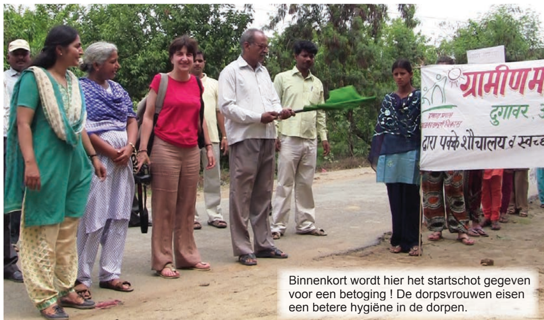
Binnenkort wordt hier het startschot gegeven voor een betoging! De dorpsvrouwen eisen een betere hygiëne in de dorpen.

Het blijft nochtans zeer moeilijk om de ouders ervan te overtuigen dat ze hun dochters naar school moeten sturen. De lokale overheden zijn dikwijls niet bereid om ontwik-