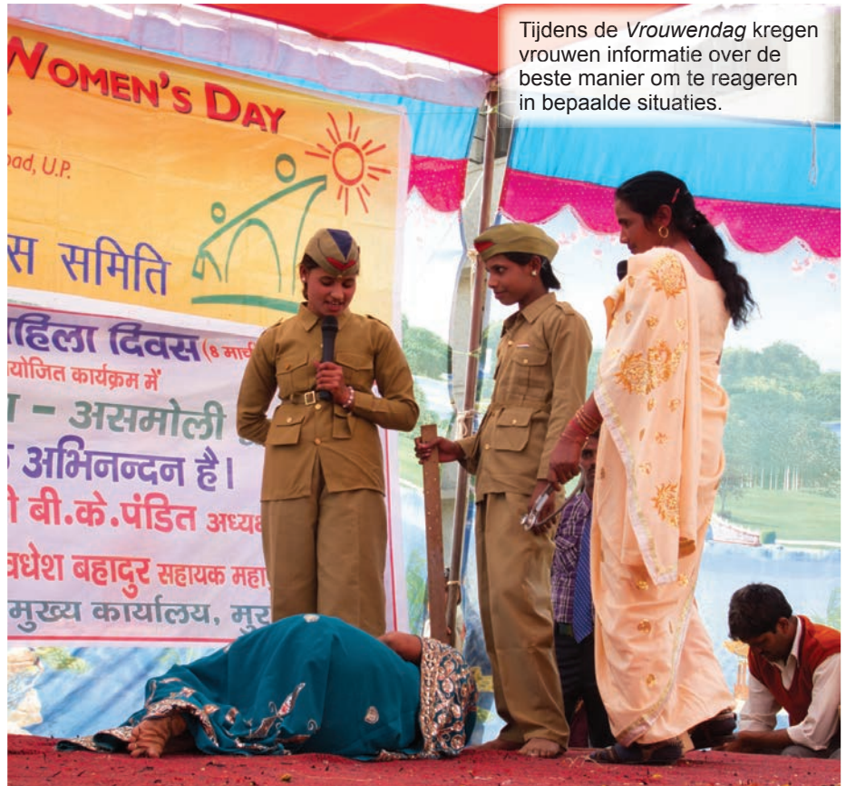
Tijdens de Vrouwendag kregen vrouwen informatie over de beste manier om te reageren in bepaalde situaties.

Hoewel Mittal van Indiase oorsprong is, verkoos hij naar Engeland te emigreren, zoals zo vele Indiërs. Hij woont in Londen. Mittal vertegenwoordigt weliswaar een realiteit : dat er vele zeer rijke mensen zijn in India, terwijl de grote meerderheid de eindjes nauwelijks aan elkaar kan knopen. Wie India een beetje kent zal het zeker met mij eens zijn als ik zeg dat India nu eenmaal een land is van extreme contrasten.