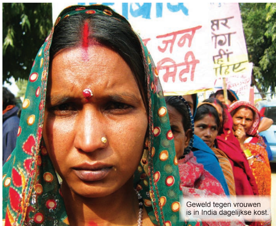
Geweld tegen vrouwen is in India dagelijkse kost.

Misschien denkt u dat het hier om geïsoleerde incidenten gaat, maar dat is niet zo. Ik ken persoonlijk vele jonge meisjes en vrouwen die het slachtoffer zijn geworden van geweld, en ik heb zelf ook aan den lijve ondervonden hoe dit in zijn werk gaat. Toen ik 15 jaar geleden in