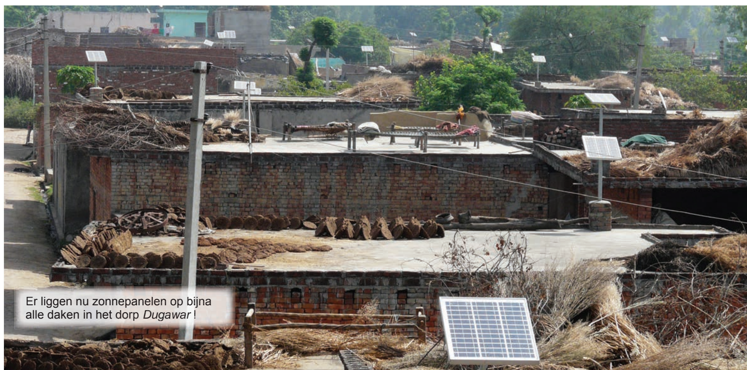
Er liggen nu zonnepanelen op bijna alle daken in het dorp Dugawar !

De batterij zou minimum 5 jaar moeten werken. De totale kostprijs van 14.500 roepies (180 euro), zal verlaagd worden met ongeveer 30%. De veldwerkers van Werk der Broden hebben het op zich genomen om dit overheidsproject te begeleiden en de zonnepanelen in het dorp te installeren. De pakketten zijn tot nu toe in 150 huizen in Dugawar geïnstalleerd.