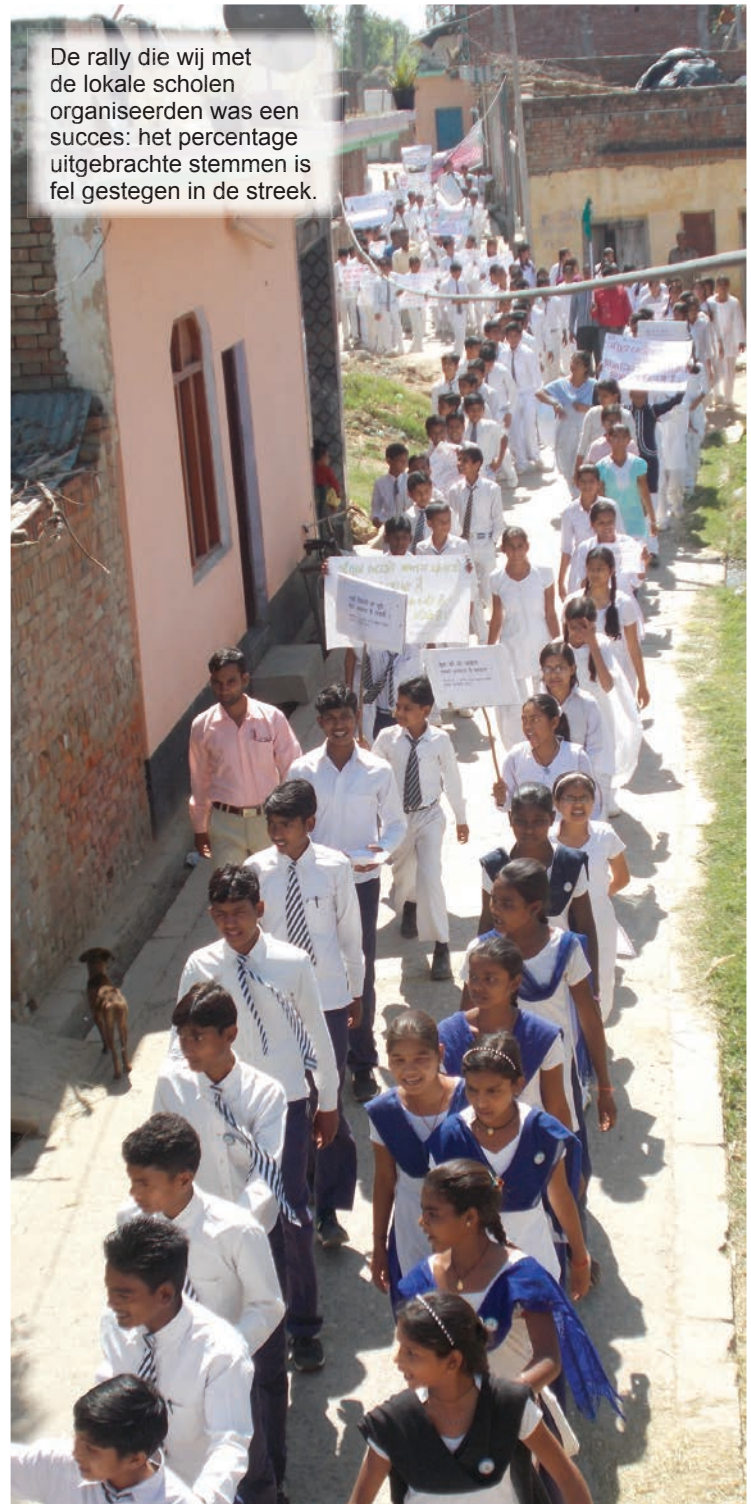
De rally die wij met de lokale scholen organiseerden was een succes: het percentage uitgebrachte stemmen is fel gestegen in de streek.

Op de dag waarop de resultaten gepost werden, kwamen sommige leerlingen naar school om de resultaten te bekijken die op de website van de School Board waren gepubliceerd. De spanning in het kantoor was te snijden, maar toen de goede uitslagen zichtbaar werden, sloeg de stemming geleidelijk om. Het was zo een