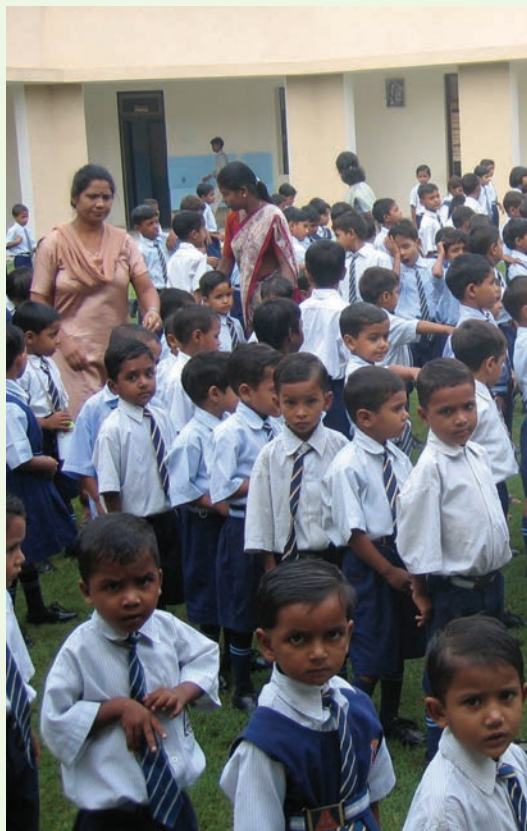
Er zijn vele nieuwe leerlingen ingeschreven. Sint-Antoniusschool telt nu 300 leerlingen...

Het tweede schooljaar van de Sint-Antoniusschool is op 1 juli van start gegaan. In tegenstelling tot vorig jaar hadden de ouders hun kinderen dit keer al tevoren ingeschreven. Vermits wij niet alle kinderen tot de school kunnen toelaten, hebben wij de eersten die zich kwamen aanbieden ingeschreven, maar de meisjes hebben we allemaal aangenomen. Er waren immers niet genoeg meisjesleerlingen naar onze normen, dus zijn we arme meisjes gaan opzoeken om ze te kunnen inschrijven.