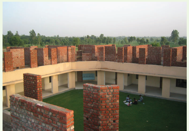
Wij zijn begonnen met de bouw van de eerste verdieping van de Sint-Antoniusschool (Dugawar, India) tijdens de schoolvakantie (mei-juni).

In de laatste nieuwsbrief schreven wij al over het feit dat we er nieuwe mensen bij hadden gekregen om de ronde van de dorpen te doen. Zij zijn van deur tot deur gegaan om de bewoners te ontmoeten en een goed beeld te krijgen van de levenswijze van de dorpelingen. Daarbij is gebleken dat velen lijden aan besmettelijke ziekten en dat de gezondheid van de mensen in het algemeen erbarmelijk is. De staf suggereerde dat wij misschien Gezondheidskampen konden organiseren in de dorpen, waar de mensen zich door artsen kunnen laten onderzoeken. Nog een gebied waarop wij ons nuttig kunnen maken is het ondersteunen van de openbare scholen, die hier zeer slecht presteren. De enige manier om hen hulp te bieden is door alle ouders te motiveren om hun kinderen regelmatig naar school te laten gaan en te zorgen dat er nieuwe leerkrachten worden aangeworven die de huidige leraars kunnen bijstaan en ervoor kunnen zorgen dat de plaatselijke scholen beter worden georganiseerd.