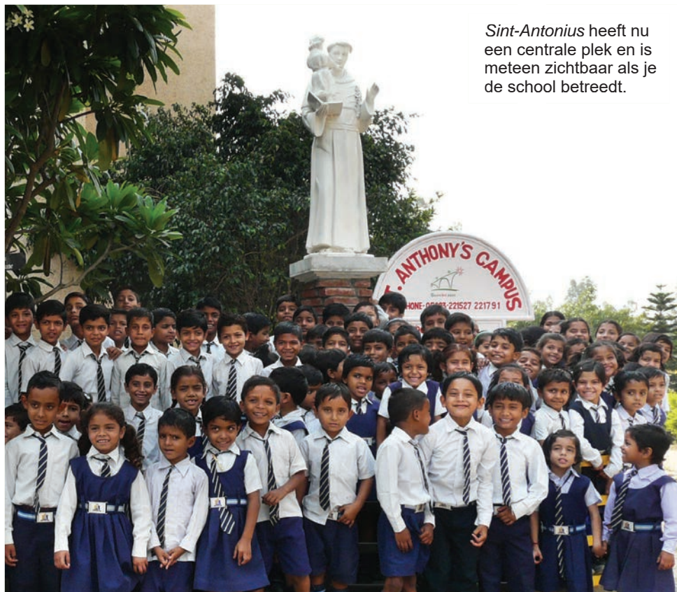
Sint-Antonius heeft nu een centrale plek en is meteen zichtbaar als je de school betreedt.