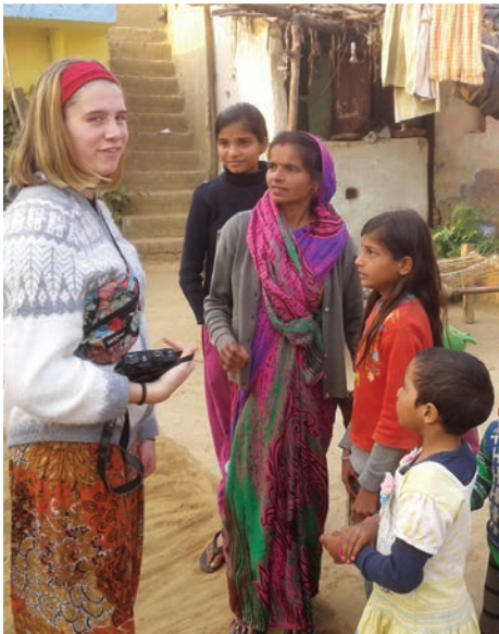
Ik werd overal heel goed ontvangen. Ik kreeg zelfs een pagina in de krant !

ik besepte dat marketing daar belangrijker leek dan de hulpverlening. Toen koos ik voor het Werk der Broden en de Sint-Antoniusschool , want aangezien ik me er zeer van bewust ben dat ik veel geluk heb gehad, is toegang tot onderwijs een onderwerp dat me nauw aan het hart ligt en waarvoor ik me graag wilde inzetten.