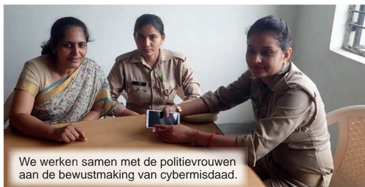
We werken samen met de politievrouwen aan de bewustmaking van cybermisdaad.

te gaan. Maar twee maanden geleden kreeg onze programma-coördinator een telefoontje vanuit haar dorp, om ons te laten weten dat ze zelfmoord had gepleegd. Hij haastte zich ter plaatse en vernam dat ze 's ochtends vroeg naar de tempel was gegaan en daarna het huis nabij de tempel was gaan schoonmaken.