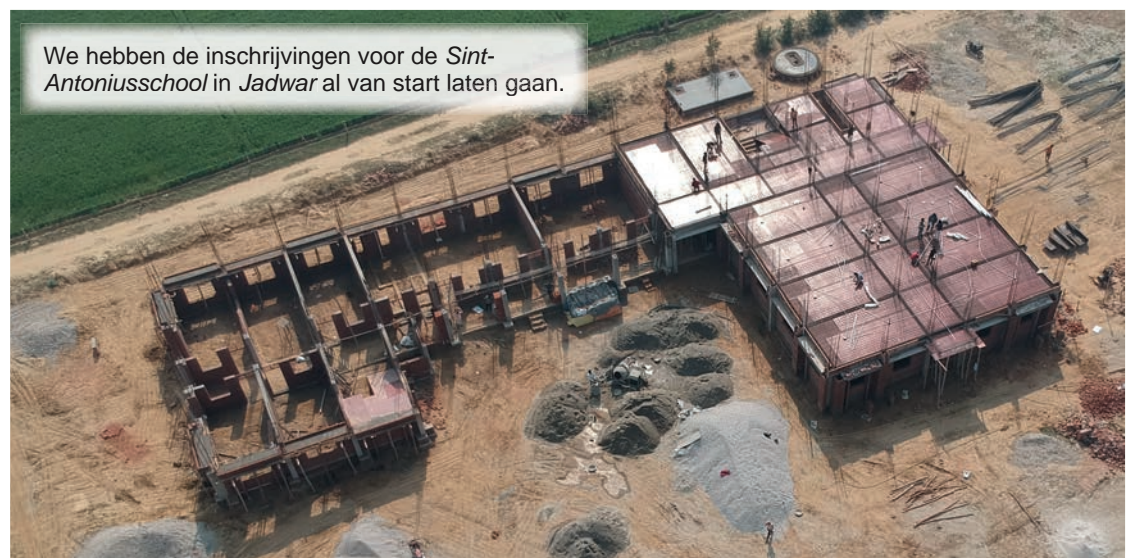
We hebben de inschrijvingen voor de Sint-Antoniusschool in Jadwar al van start laten gaan.