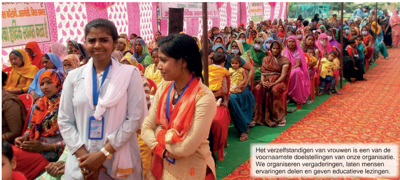
Het verzelfstandigen van vrouwen is een van de voornaamste doelstellingen van onze organisatie. We organiseren vergaderingen, laten mensen ervaringen delen en geven educatieve lezingen.