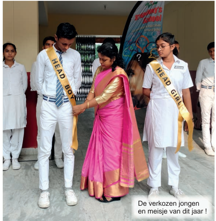
De verkozen jongen en meisje van dit jaar !

verantwoordelijkheid te leren opnemen, maar ook om verandering in hun dorpen teweeg te brengen. Ze kunnen hun rationele denkwijze inzetten om invloed uit te oefenen op hun fa- milies en buurtgenoten.