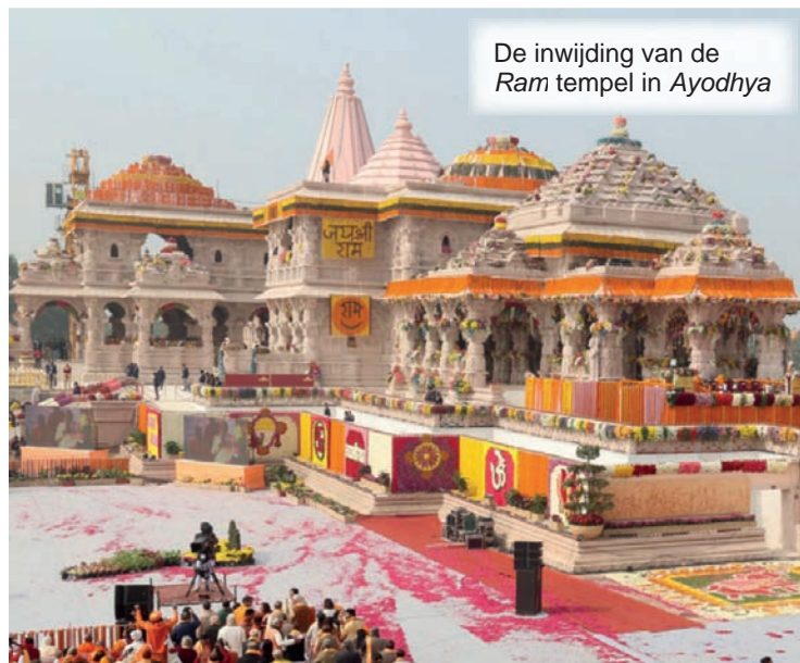
De inwijding van de Ram tempel in Ayodhya

De inauguratie van de Ram-tempel door premier Modi op 22 januari in Ayodhya was een evenement met natiewijde weerklank. Alle deelstaten bestuurd door de BJP hielden de scholen en hogescholen gesloten en riepen een volledige of halve dag overheidsvakantie uit om mensen aan te moedigen, de ceremonie bij te wonen. Zelfs de Indiase effectenbeurzen waren gesloten ! Modi vroeg de mensen om