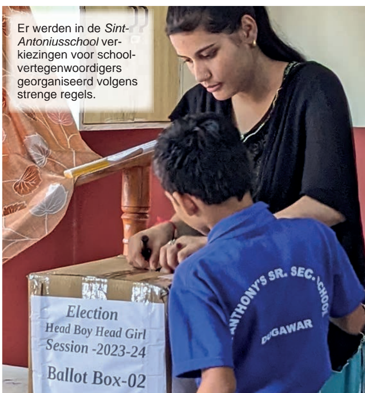
Er werden in de Sint-Antoniusschool verkiezingen voor school- vertegenwoordigers georganiseerd volgens strenge regels.