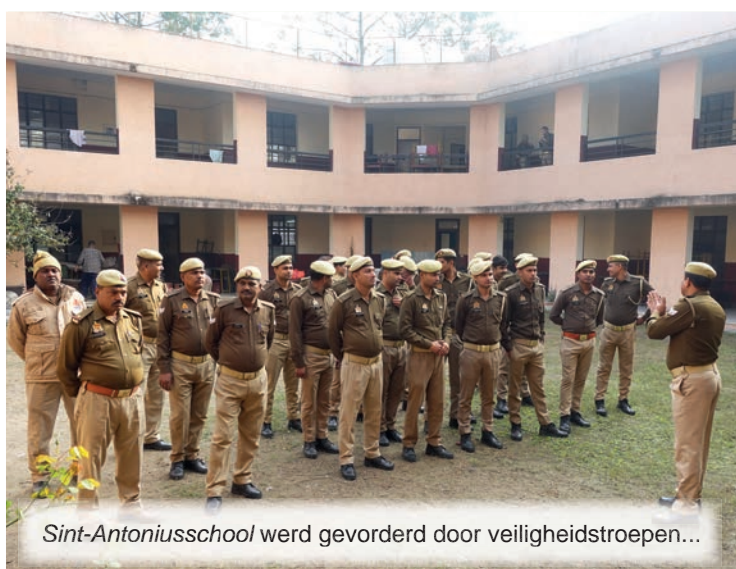
Sint-Antoniusschool werd gevorderd door veiligheidstroepen...

Slechts een maand na de inauguratie van de Ram-tempel bezocht Narendra Modi een dorp niet ver van de Sint-Antoniusschool Du-